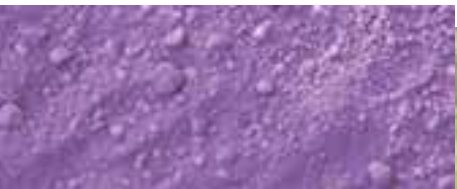
1312 viola ultramarino