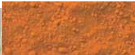
1306 giallo arancione