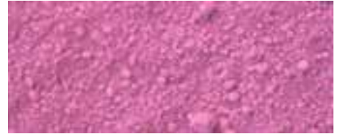
1313 rosso ultramarino