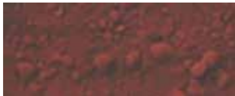
1302 rosso ossido