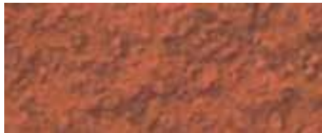
1304 rosso ocra