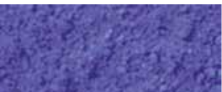
1310 blu ultramarino