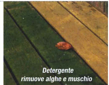
Detergente rimuove alghe e muschio

Manutenzione e Cura per il legno con Oli e Detergenti GORI