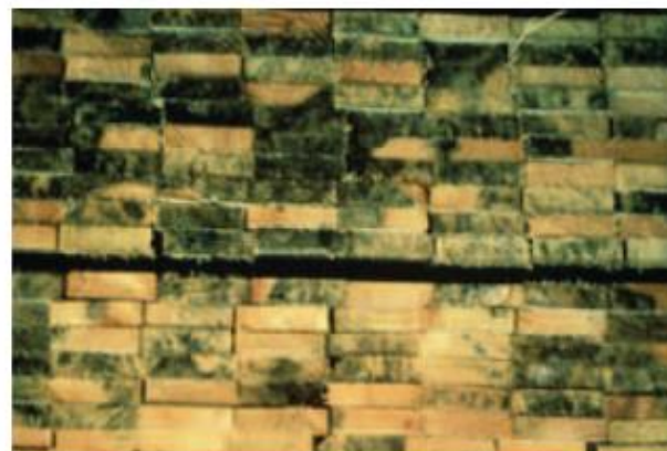
Legno contaminato da Azzurramento