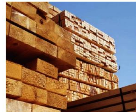
Legno con protezione